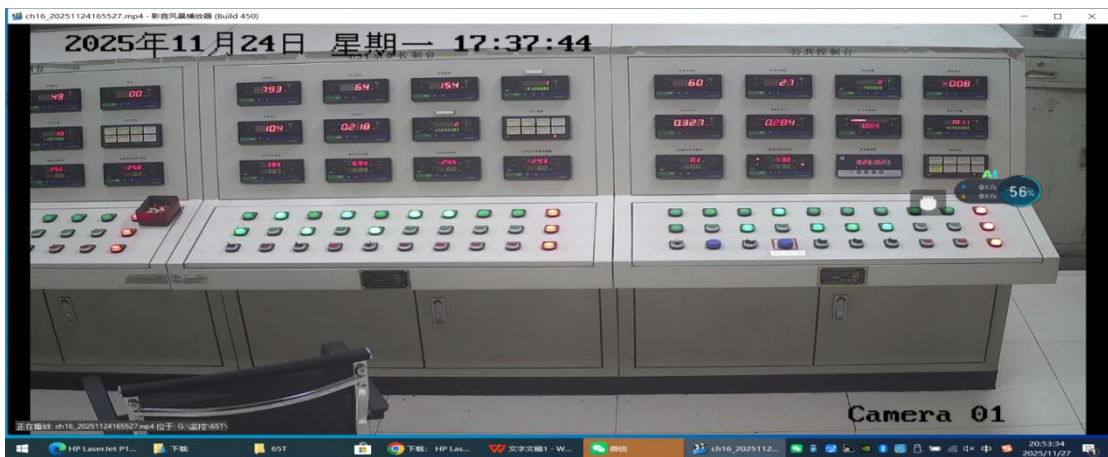
中控室操作台显示器最高正压值图